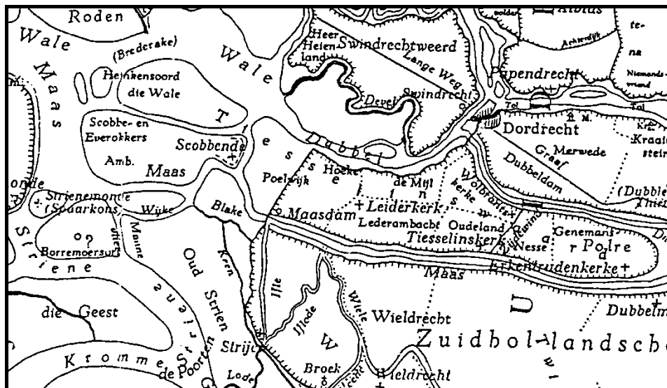
Afb. 1. Uitsnede kaart van Holland omstreeks 1300

De toenaam van het geslacht is ontleend aan de 'Wifliet'. Dit was de verbinding van de Oude Maas met de Dubbel. 6 Deze verbinding liep langs het ambacht Scobben en Everocker en de Tiesselingswaard (afb. 1), waar zij geood waren.