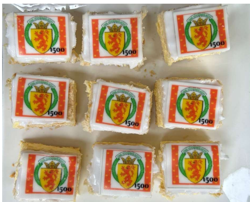
Gebak bij een nieuwe mijlpaal: meer dan 1.500 leden!