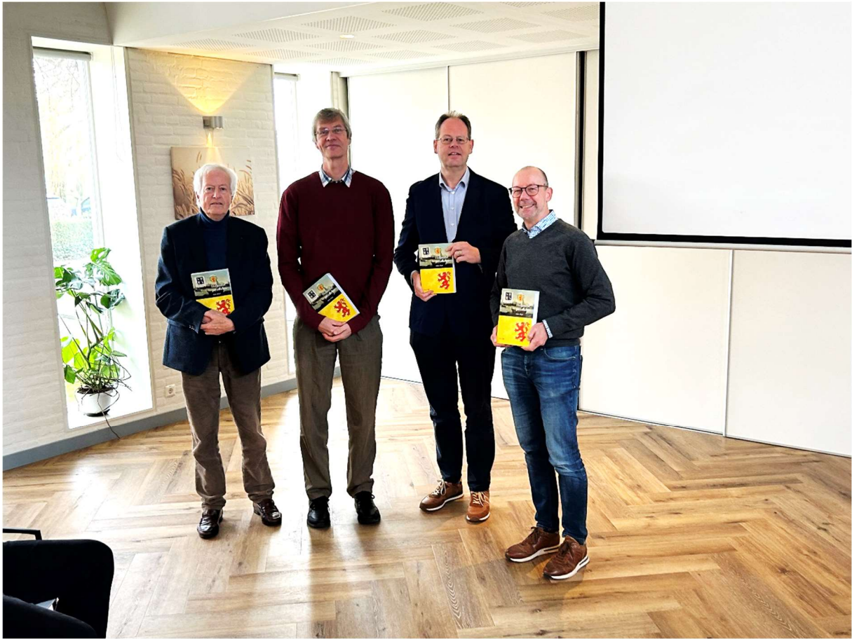
Nieuwjaarsreceptie met presentatie van Hollandse Parentelen deel 3.