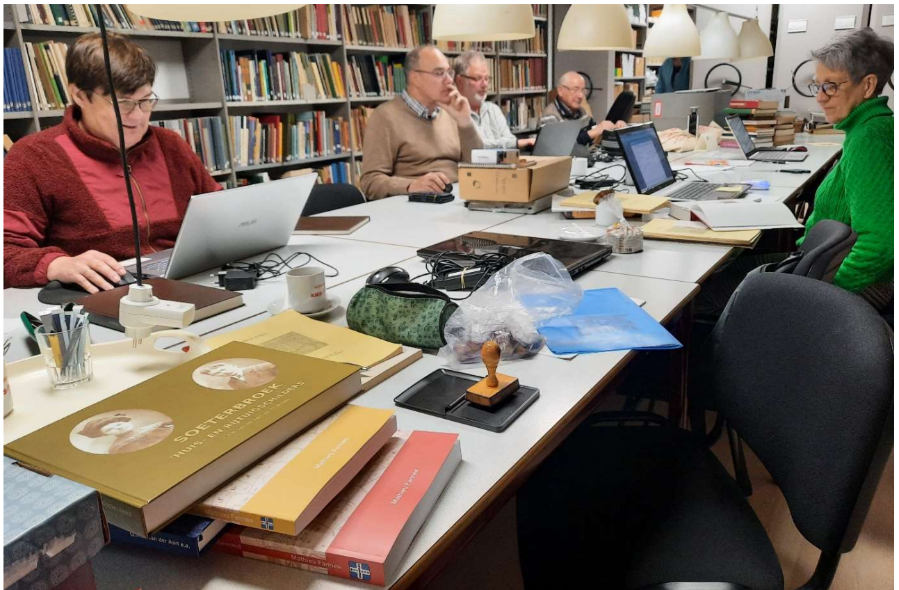
Bestuursleden en andere vrijwilligers aan het werk.