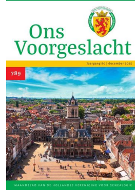
nr 789 — december 2025