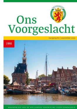
nr 786 — september 2025