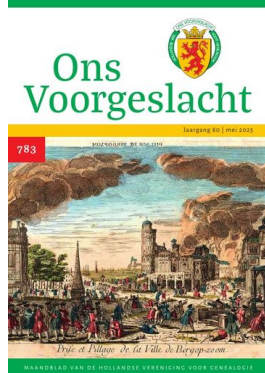
nr 783 — mei 2025