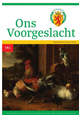
nr 781 — maart 2025