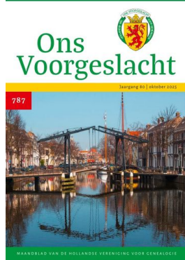
nr 787 — oktober 2025