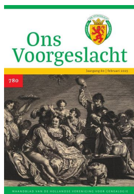
nr 780 — februari 2025