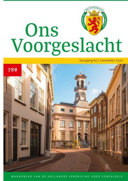
nr 788 — november 2025