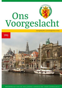
nr 785 — juli/augustus 2025